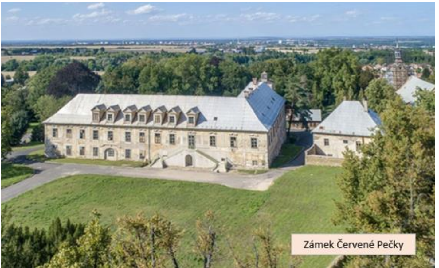
Zámek Červené Pečky