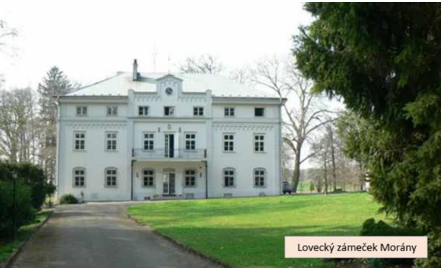
Lovecký zámek Morány