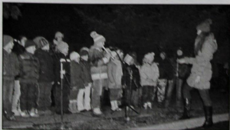
Rozsvícení vánočního stromu

Během školního roku probíhají na škole dlouhodobé i krátkodobé - tematické projekty. Škola je zapojena například do projektu „Ovoce do škol“, „Zdravá záda“, „Zdravé zuby“, „Školní mléko“, „Český den proti rakovině“ aj. Výuka je obohacena odbornými