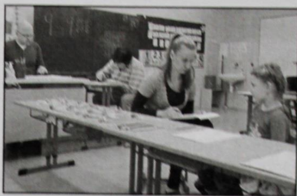
Zápis do 1. ročníku

přednáškami, jako Policie ČR, Červený kříž, SDH Dobromilice, Myslivecký spolek Dobromilice, IRIS Prostějov - ochránci přírody, EKO-KOM - třídění a recyklace odpadů a další. Navštěvujeme divadlo, dopravní hřiště, pořádáme tvořivé dílny atd. Škola spolupracuje s místním obecním úřadem při jejich akcích