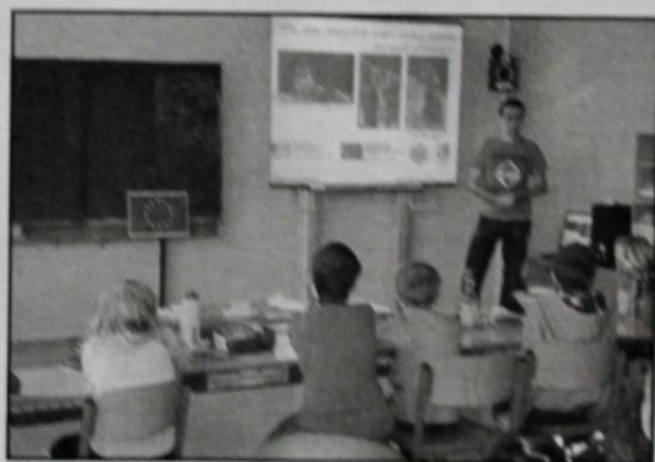
DEN ZEMĚ – Velké šelmy

přednáškami, jako Policie ČR, Červený kříž, SDH Dobromilice, Myslivecký spolek Dobromilice, IRIS Prostějov - ochránci přírody, EKO-KOM - třídění a recyklace odpadů a další. Navštěvujeme divadlo, dopravní hřiště, pořádáme tvořivé dílny atd. Škola spolupracuje s místním obecním úřadem při jejich akcích